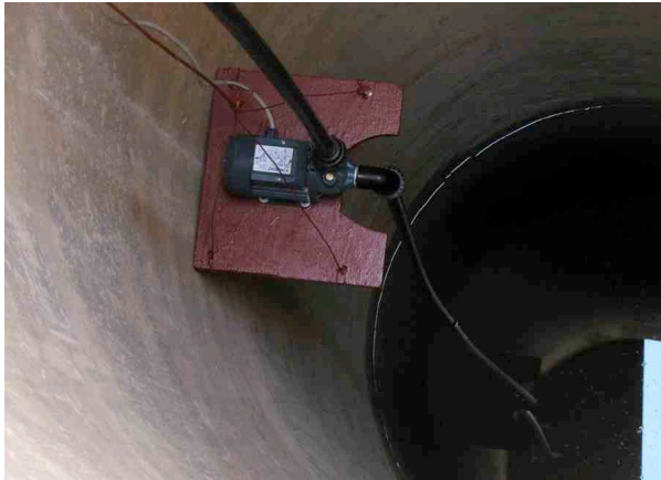
Die Elektropumpe, 6m tief im Brunnen montiert

Die Leitung der Wasserversorgung an der wir angeschlossen sind, ist schon seit Wochen trocken. Für unsere Neubepflanzungen, die Küche, die Lavabos und Toiletten brauchen wir rund 1.5 m 3 Wasser pro Tag. Um den eigenen Wasserbedarf sicher zu stellen, rüsten wir unseren Brunnen mit einer Pumpe aus und montieren einen Wasserbehälter auf einem einfachen Holzgerüst.