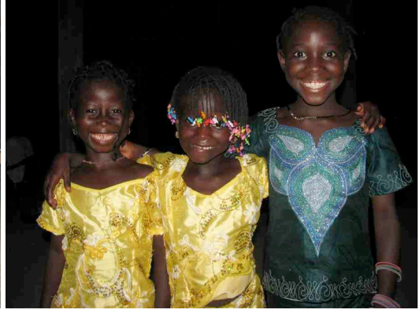
und nicht nur die Kinder freuen sich