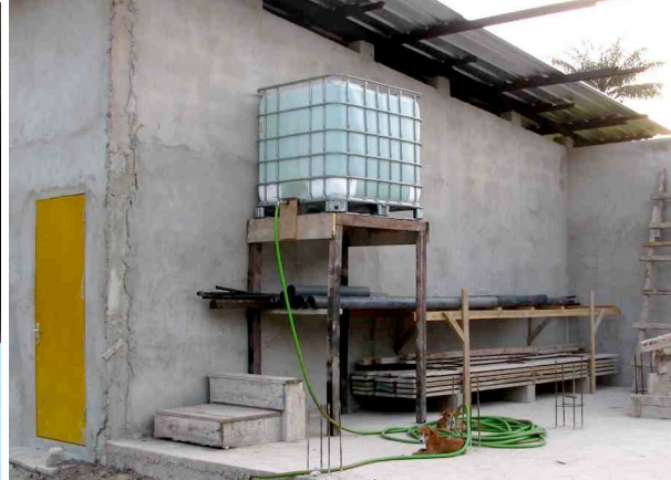
Unser 1000 Liter-Wassertank