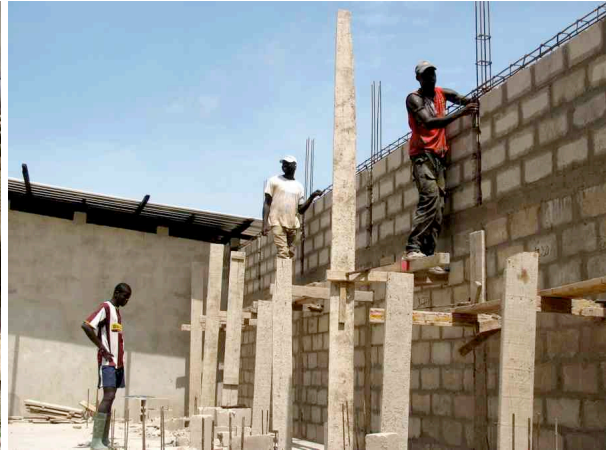
Die Rückwand der Trocknungshalle gegen die Strasse kurz vor der Fertigstellung